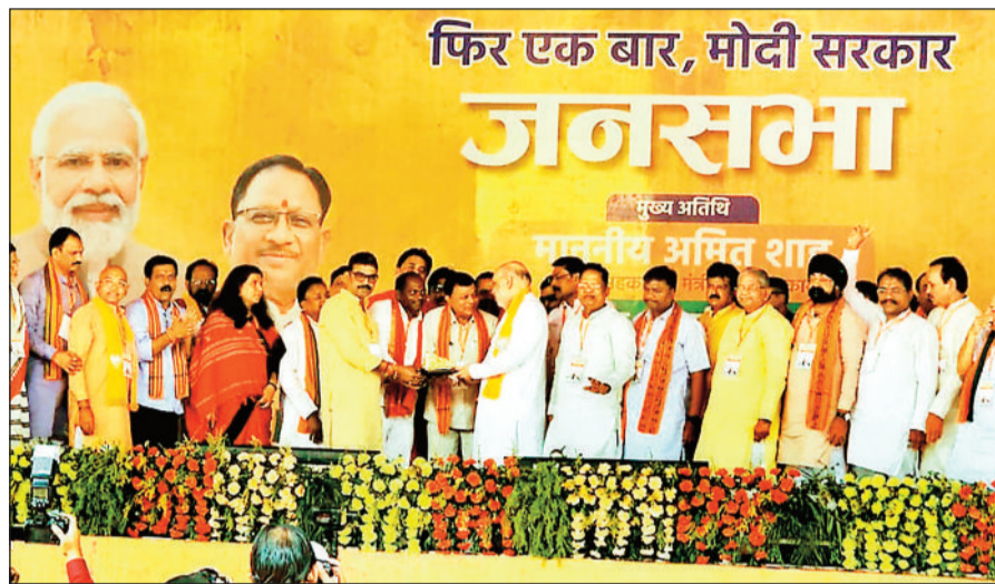
कटघोरा के मेला ग्राउंड में आयोजित आम सभा के दौरान केंद्रीय गृहमंत्री अमित शाह।

जनसभा को संबोधित करते हुए अमित शाह ने कहा कि छत्तीसगढ़ भगवान राम का ननिहाल है। मैं राम के ननिहाल वालों के सामने आया हूँ। मुझे बताइए कि अयोध्या में राम मंदिर बनना चाहिए या नहीं बनना चाहिए था। ये कांग्रेस पार्टी जो हमारे खिलाफ लड़ रही है जिसने 70 सालों राम जन्मभूमि के मसले को अटका कर, लटक कर और भटका कर रखी। छत्तीसगढ़वासियों ने 11 में से 9 सीट देकर मोदी जी को दूसरी बार प्रधानमंत्री बनाया। इन 5 वर्षों में केस भी जीता, भूमिपूजन भी हुआ और 22 जनवरी को रामलला की प्राण प्रतिष्ठा कर जय श्रीराम कर दिया। कांग्रेस ने 5 सी सालों तक भगवान राम को अपमानित कर मंदिर में नहीं बैठाया। 5 सी साल बाद हम ऐसे भायखान लोग हैं जिनके जीवन में यह दिन आया कि हमने भगवान राम के कपाल पर सूर्यलाल देखा और ये कांग्रेस पार्टी जब अयोध्या में रामलला की प्राण प्रतिष्ठा हो रही थी