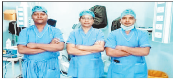
सफल आपरेशन करने वाले चिकित्सकों की टीम।

मेडिकल कॉलेज जिला अस्पताल के डॉक्टरों ने वह करिश्मा कर दिखाया, जिसकी उम्मीद किसी की नहीं थी। उन्होंने सीमित संसाधन के बीच लगभग ढाई घंटे के आपरेशन के बाद वृद्ध के घुटने को बदल डाला, जिससे खुद को लाचार महसूस करने वाली वृद्ध चलने-फिरने के काबिल हो गई है। यह कामयाबी गरीब तबके के मरीजों के लिए किसी वरदान से कम नहीं है। खास बात तो यह है कि राजधानी के बाद कोरबा का मेडिकल कॉलेज घुटना प्रत्यारोपण करने वाला दूसरा