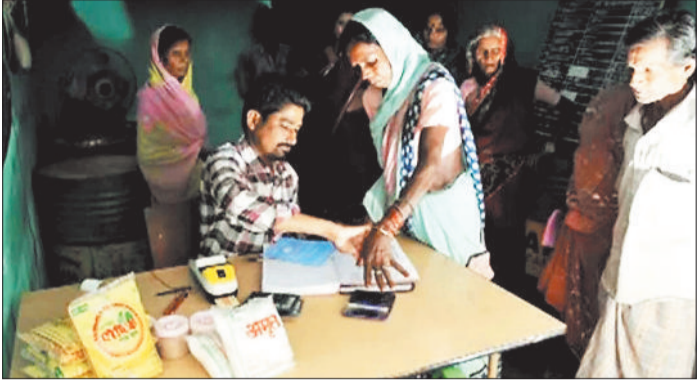
पीडीएस दुकान में राशन लेते हितग्राही।

पीडीएस दुकानों में चना और शक्कर की सप्लाई कम होने से हितग्राहियों को कम मात्रा में खाद्यान्न सामग्री मिल रही है और कई हितग्राही बैरंग लौट रहे हैं। चुनावी दौर होने के कारण हितग्राहियों के इस खाद्यान्न